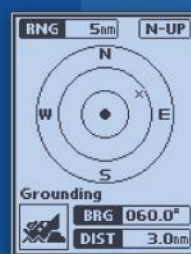
Ekran z pozycją